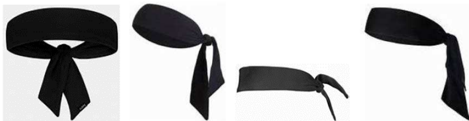
Obrázek 1 Příklady čelenek typu „kravata“

4 - 4 Ustanovení. Nošení čelenky typu „kravata“ není povoleno.