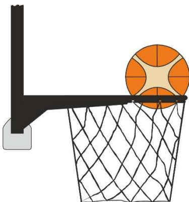
Obrázek 4 Míč v koši

31 - 24 Ustanovení. Jestliže se bránící hráč dotkne míče, který je v koši, je to přestupek.